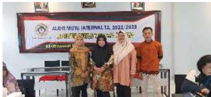
Gambar 1.2 Kegiatan Audit Mutu Internal