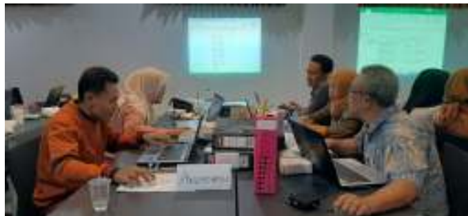
Gambar 1.1 Kegiatan Audit Mutu Internal.